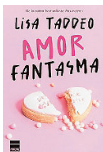
«Amor fantasma» Lisa Taddeo PRINCIPAL 224 páginas, 17,95 euros

La premiada autora de «Tres mujeres» presenta una electrificante colección de nueve relatos. Narra los misteriosos consejos que un ejército de chicas brindan a través de una aplicación de citas mientras otras tres compiten por un corazón en Los Ángeles. La autora habla de asuntos como la obsesión, la ceguera del amor y el dolor causado por los hombres.