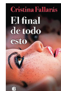
«El final de todo esto» Cristina Fallarás EDICIONES B 464 páginas, 22,90 euros

Se recupera la conmovedora historia de Nicholls sobre la relación entre Emma y Dex al coincidir con una miniserie de Netflix. Esta edición vuelve a abordar la conexión entre un joven despreocupado y de familia adinerada con una chica de clase trabajadora y un humor más que inteligente. ¿Cómo evolucionará este amor a lo largo de unos largos veinte años?