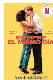
«Siempre el mismo día» David Nicholls UMBRIEL 448 páginas, 19 euros

Que Europa quedara devastada durante medio siglo no impidió que la música continuase con su formidable desarrollo. Así, Alemania prosiguió su glorioso camino iniciado con Bach y transitado luego por Haydn, Beethoven, Schumann, Wagner... para desembocar, en pleno nazismo, en una explosión creativa que llevó hasta el límite la armonía tradicional.