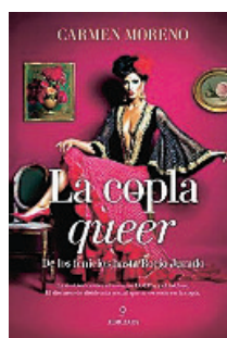
«La copla queer» Carmen Moreno ALMUZARA 160 páginas, 17 euros

La premiada autora de «Tres mujeres» presenta una electrificante colección de nueve relatos. Narra los misteriosos consejos que un ejército de chicas brindan a través de una aplicación de citas mientras otras tres compiten por un corazón en Los Ángeles. La autora habla de asuntos como la obsesión, la ceguera del amor y el dolor causado por los hombres.